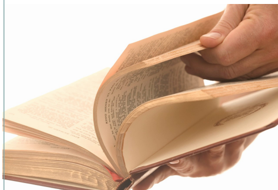
Måske sætter du pris på højtlesning